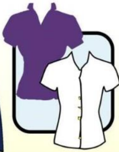
BLOUSE WITH SLEEVES