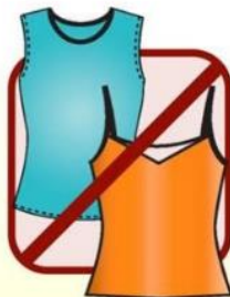
SLEEVELESS AND PLUNGING NECKLINES