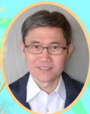
By Bryan Shen

[NOMINAL REGISTRATION FEE: RM50 PER HEAD TO COVER MEALS]