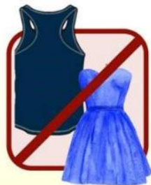
TUBES AND RACERBACKS