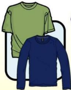
T-SHIRT OR LONG SLEEVES