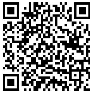
Catholic Welfare Services

BAIK - Sila teruskan untuk membantu 'Catholic Welfare Services' secara kewangan dalam pelayanan kita kepada golongan miskin dan yang memerlukan di dalam masyarakat kita tanpa mengira bangsa atau kepercayaan. Umat boleh membuat sumbangan melalui S Pay Global dengan mengimbas QR kod di sini . Sahkan bahawa penerima ialah 'Catholic Welfare Services' sebelum pemindahan dilakukan. Umat paroki juga boleh melakukan pemindahan dalam talian atau deposit tunai kepada akaun berikut: